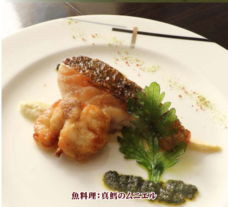
魚料理:真鱈のムニエル