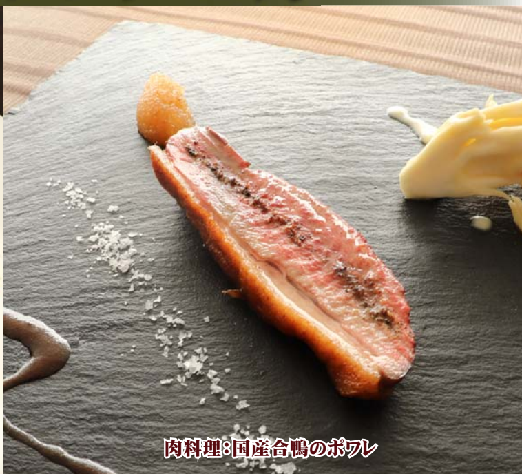
肉料理:国産合鴨のポワレ