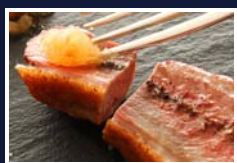
ジューシーな合鴨と甘酸っぱいリンゴのピュレが良く合います