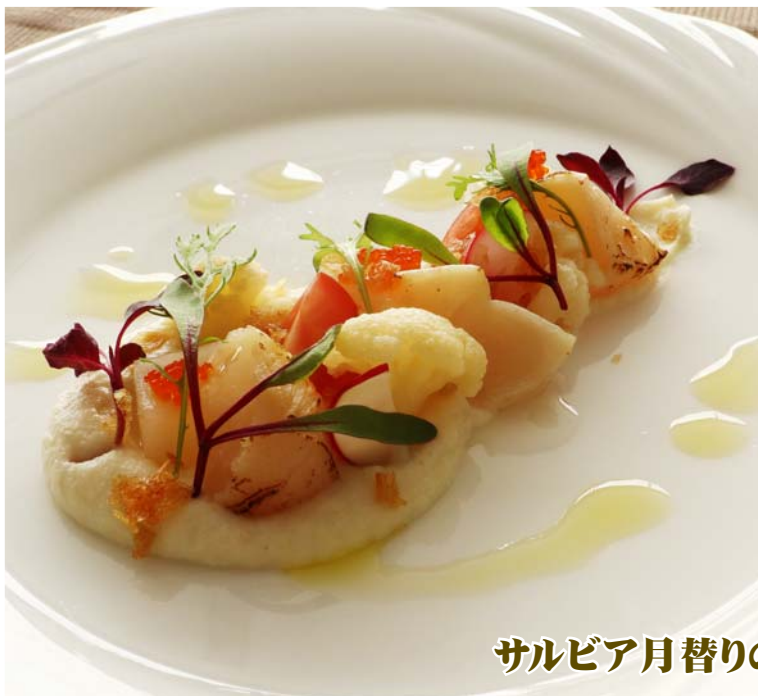
サルビア月替りのランチコース