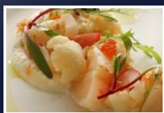
真空調理で仕上げたアカイカと帆立はカリフラワーのピュレと